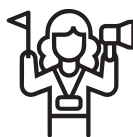
目的地管理公司 / 地接社