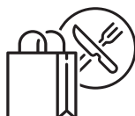
当地游玩 / 餐饮购物