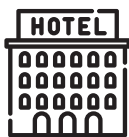
酒店 / 住宿