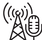
媒体 / 出版社