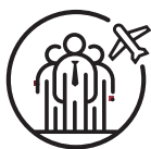
旅游机构 / 协会