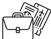
会奖旅游 / 商务旅行