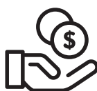
投资 / 咨询